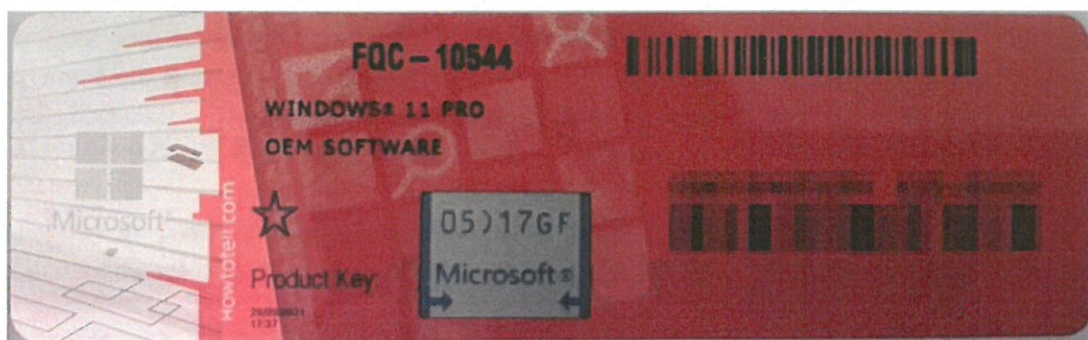
Rys. 1 przykładowy kod zabezpieczony przez producenta systemu Microsoft Windows 11 (takie same naklejki mają Windows 10) z wymazanym, znajdującym się przed i za szarą naklejką kodem licencyjnym

Poniższe zdjęcie obrazuje obecnie stosowane zabezpieczenia producenta firmy Microsoft (klucz systemu jest zabezpieczony naklejką hologramową przez producenta. Po jej zdrapaniu uzyskujemy dostęp do oryginalnego klucza):