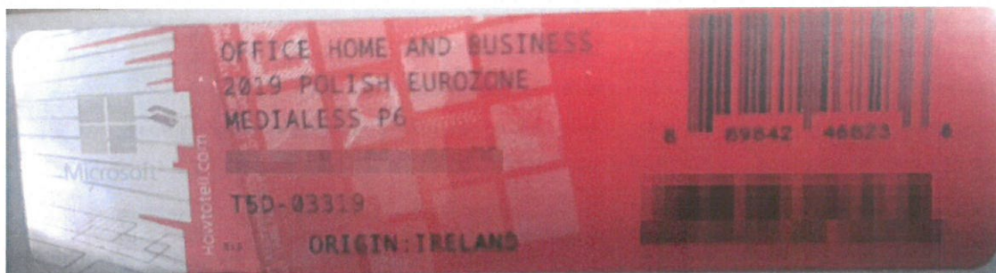
Rys. 2 przykładowy kod zabezpieczony przez producenta systemu Microsoft Windows Office Home&Business z wymazanym, znajdującym się w prawym dolnym rogu numerem seryjnym produktu. Kod licencyjny znajduje się w środku szczelnie zapakowanego i zafoliowanego pudełka (Rys. 3)